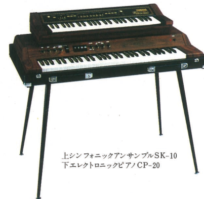
上シンフォニックアンサンブルSK-10 下エレクトロニックピアノ/CP-20