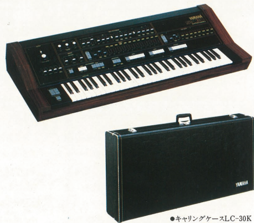
●キャリングケースLC-30K (別売) ¥18,000

テージでのサウンドチェンジもワンタッチ。またキャンセルスイッチを採用したこと、切り換え動作のスピードアップを実現しました。 ● 充実したエフェクト・付加機能 アンサンブル、トレモロ、ディレイビブラート、そしてソロシンセサイザーブロックのブリリアンス、ビブラート、モジュレーションのタッチコントロールなどSK-50Dと同等の、高度なエフェクト群を採用しました。また鍵盤を高音部、低音部に分割し別べつの音色で演奏できるキーボードスプリットも、テクニシャンには魅力の設計。さらにミックスボリューム、ストリングボリューム、ポリシンスボリューム、サステインスイッチ、ポルタメントスイッチなどフットコントロール機能も充実しています。