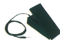
●エクスプレッションペダルFC-3A (別売) ¥6,000