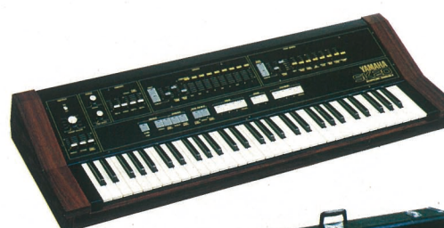
●キャリングケースLC-20K (別売) ¥15,000

レスリー端子、ヘッドホン端子の5種類。オルガン系音色とポリシンス系音色を独立してとり出すことも、ミキシングしてとり出すことも可能。またレスリー端子(11P)を使えば、トレモロコントローラーでレスリースピーカーをコントロールできます。またオブジエクト専用用STRING VOLと、MIXED VOLふたつのフットペダル用端子、及びサステイン・フットスイッチ用端子も備えています。