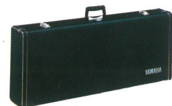
●キャリングケースLC-10K (別売) ¥11,000